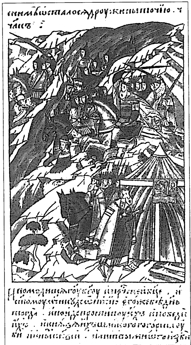
2 pav. Daumanto pskoviciečių mūšis su lietuviais ties Dauguva (miniatiūra iš „Pasakojimo apie Daumantą“ XVI a. nuorašo) (Охотникова, 1985, c. 181).

Dauguva kaip lietuvių tiesiogiai valdomos teritorijos riba figūruoja Naugardo Pirmajame metraštyje, kuriame pasakojama apie 1266 (6774) m. įvykusį Daumanto pskoviciečių ir Gerdenio vadovaujamų lietuvių mūšį (2 pav.). Čia aiškiai pažymima, kaip kariuomenės persikelia į „šia“ (t. y. – rusų) Dauguvos pusę (на сю сторону) (Полное, 1841, c. 58–59). Tas pats mūšis kiek išsamiau aprašomas ir Naugardo Ketvirtajame metraštyje (Полное, 1915, c. 236) ir „Pasakojime apie Daumantą“ (XIV a.), kurio žinoma daug variantų (Охотникова, 1985, c. 197, 201, 207). Šiuose šaltiniuose taip pat figūruoja Dauguvos pavadinimas bei