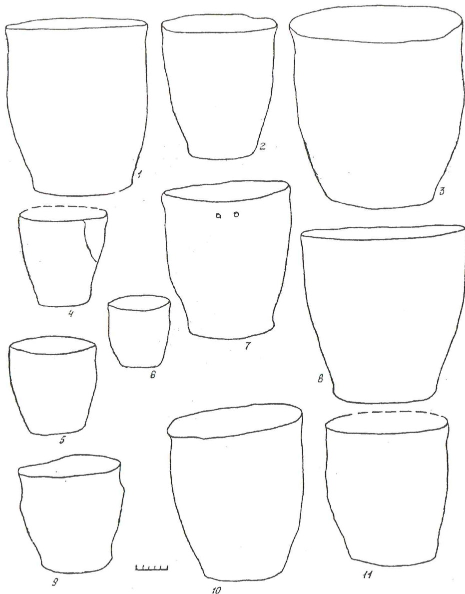
Р и с. 4. Лепная керамика из курганов VI–VII вв.: 1, 3, 4 – Янковичи; 2, 5–11 – Дорохи.

изготовленные из двух железных штырей, небольшая шпора с крючками (рис. 3) и лепная керамика. В большинстве захоронений вещи отсутствуют.