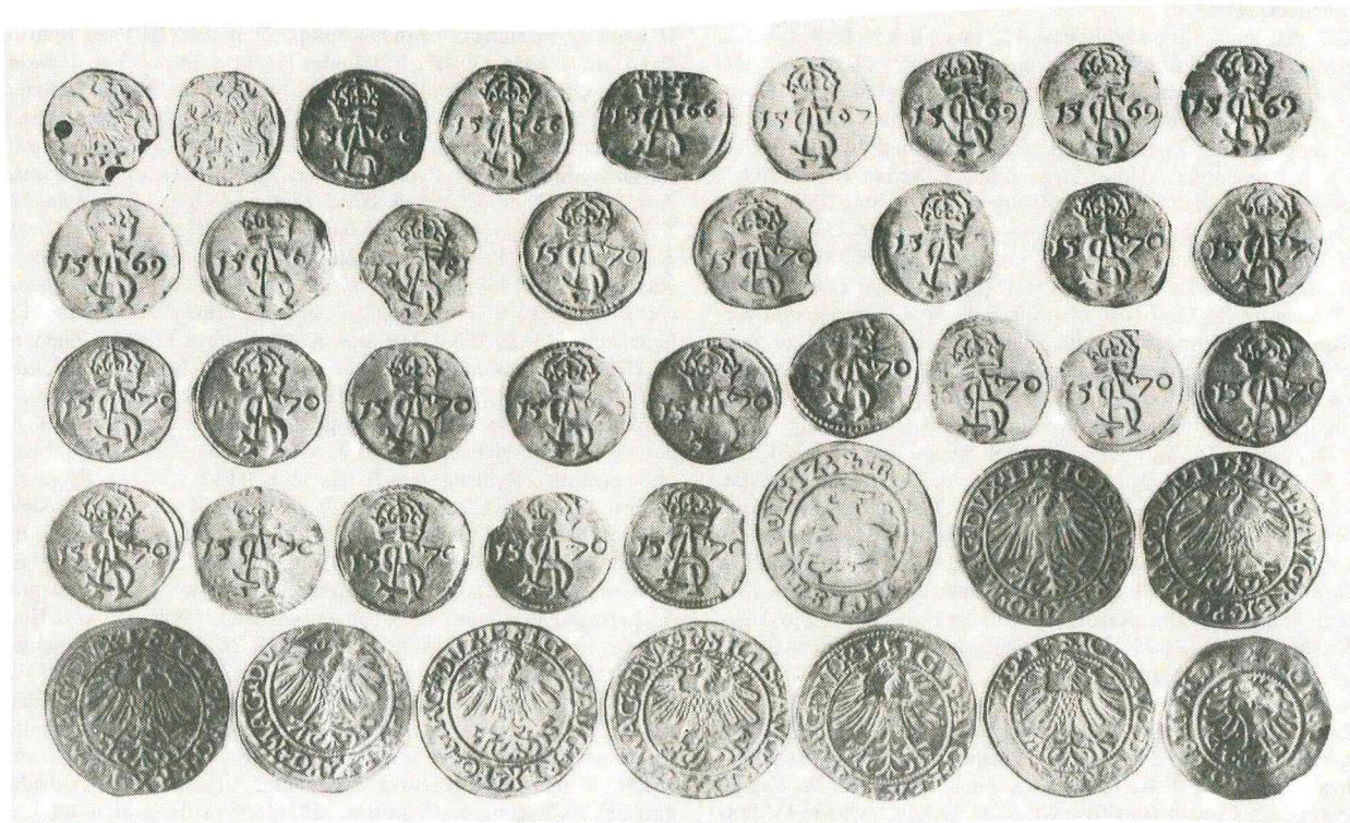
1 pav. Monetos, rastos Pavirvytės - Gudų senkapyje (Akmenės raj.), kape Nr. 177