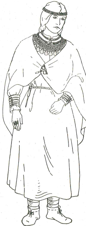
217 pav. Papuošalų nešiojimo rekonstrukcija pagal kapo Nr. 311 radinius

Iš retai aptinkamų Plinkaigalyje papuošalų reikia paminėti žalvarinių įvijų, sujungtų grandelėmis, apgalvius. Jų rasta kapuose Nr. 311 ir 315 (pav. 217). Taip pat svetimas papuošalas buvo ilga žalvarinė įvija ant pakaušio su kilpelėmis ir grandinėlėmis bei kabučiais galuose (k. Nr. 19, 188, A). Nebūdingas suaugusiųjų drabužių susegimas smeigtukais. Nors jų aptikta 121, tačiau absoliuti dauguma iš vaikų kapų. Jais susegdavo drabužius ar drobules. Aptiktos vos kelios žalvarinės juostinės apyrankės iškilia trikampė briauna (k. Nr. 121, 128).