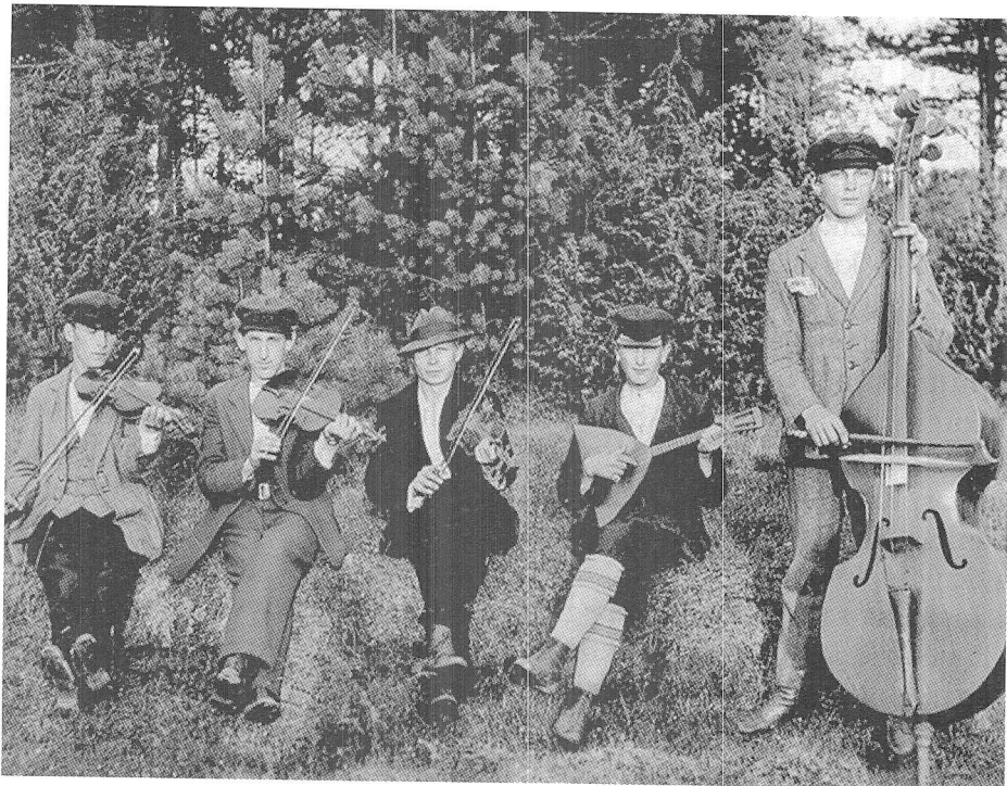
3 pav. Vestuvių muzikantai. Spaudžių k., Šaukėnų vls., Šiaulių aps.