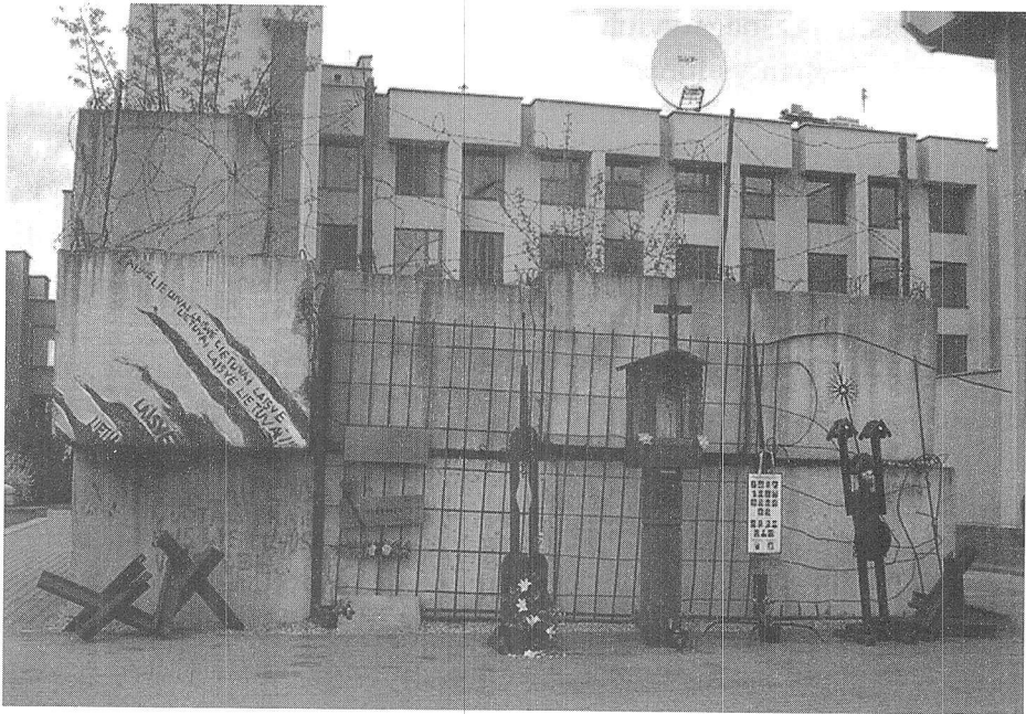
Dabartinis LR Seimo barikadų vaizdas. 2005

Lietuvoje irgi pastebima visoms pokomunistinėms visuomenėms būdinga į vakarietišką bent išoriškai panaši oficialiųjų paminklų atmetimo tendencija, slypinti komplikuotame ir skausmingame santykiyje su totalitarinės monumentalistikos palikimu. Nepamirškime, kad būtent ši meno forma ilgiausiai išlaikė totalitarinio meno principus ir yra laikoma šių režimų klasikine apraiška (Glinskis 1995: 3).