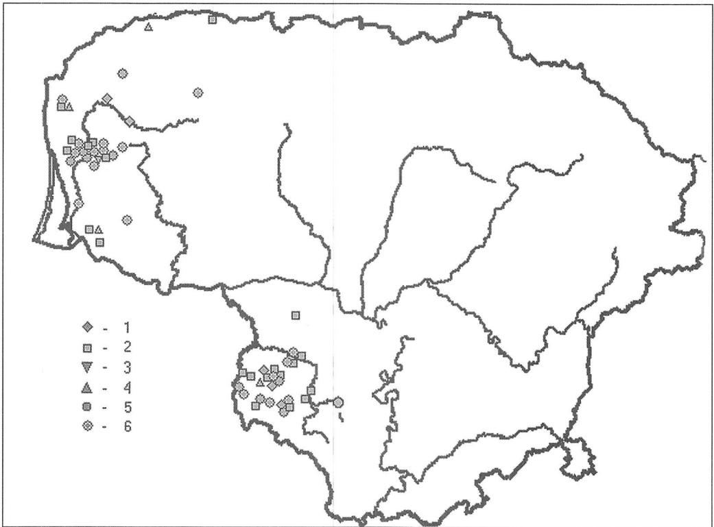
2 žemėlapis. Vaikino elgesys su mergina, atsisakius jai šokti Suvalkijoje ir Žemaitijoje (1940–1990): n = 59.

1 – paliko šokio viduryje; 2 – skėlė antausį; 3 – spjovė į veidą; 4 – spyrė į sėdmenis arba į koją; 5 – išvadino necenzūriniais žodžiais; 6 – kita (nekvietė šokti, šokdino be poilsio, tyčiojosi, pastūmė, patampė, sumušė, užpuolė einančią namo)