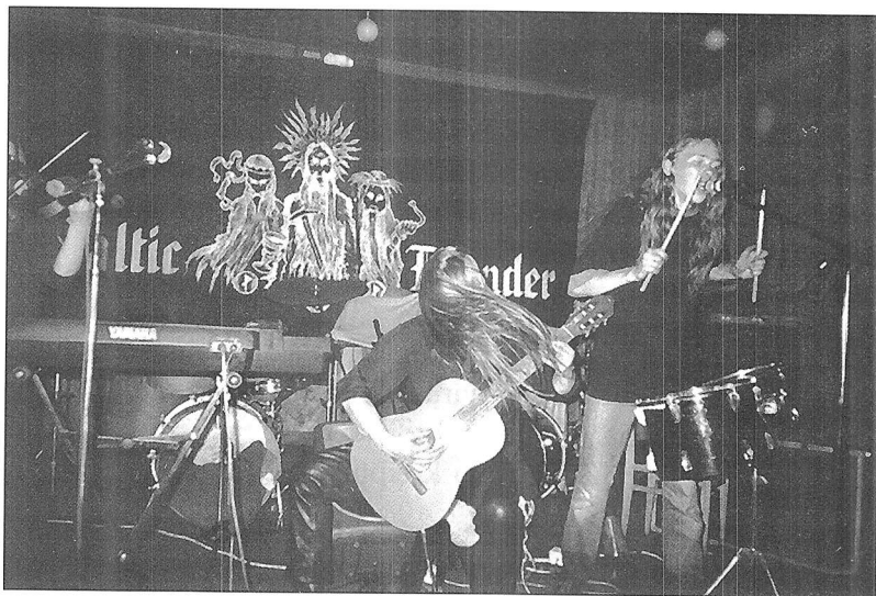
Tradicinis jaunimo muzikinio undergroundo pagoniškujų menų festivalis „Mėnuo Juodaragis“. Metalo muzikos koncertas. 2000 m. rugpjūčio 25–27 d. Utenos r. Sudeikiai.

Mikrofoninis balsas skelbė pasaulio pabaigą. „Gera tik šiandien, rytoj bus karas. <...>. Paslaptingu laiku susitiko dvi jūros, neaprepiamos žvilgsnio. Susirinko stipriausi, visi kas karaliauja“. Kalbėjo apie kalavijų nukirstas archajiškas pranašystes, magiškus skaičius, besikaupiančią įtampą, kuriai sprogtus liejasi karšta geležis. „Tai paskutinis karas“. Nuskambėjo birbynės melodija, susipinanti su melancholiškais elektroninių instrumentų garsais, lydima tartinės interpretacijų.