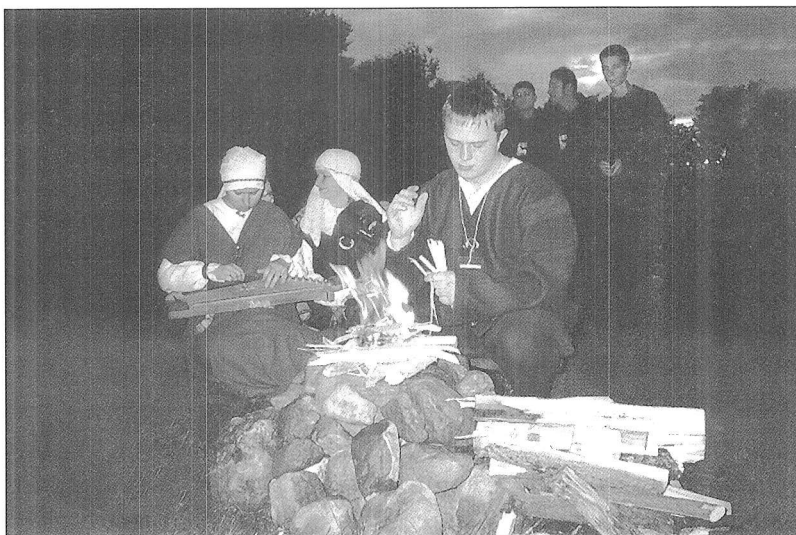
Tradicionis jaunimo muzikinio undergroundo pagoniškujų menų festivalis „Mėnuo Juodaragis“. Ugnies apeiga. 2000 m. rugpjūčio 25–27 d. Utenos r. Sudeikiai.

Ugnies apeigos. Temo, kai užgrojo kanklininkė. Apeigų kūrėjų manymu, „ugnis išsižiebia, kuomet prabyla senovinis instrumentas – kanklės. Ugnies išiebigimas – tai kūrybos pradžia. Žodis „kurti“ turi dvi reikšmes – išiebigti ugnį ir kurti pasaulį. Uždegus Ugnį, į ją buvo kreiptasi pasaulio tvėrimo giesmėmis.