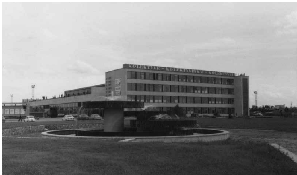
2 pav. Fontanas prie Alytaus eksperimentinių namų statybos kombinato administracinio pastato. Nuotrauka daryta maždaug 1976 m.