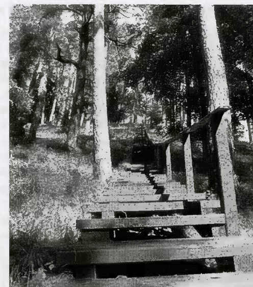
2. Wzgórze Szubieniczne w pobliżu Wysokiego Dworu — wolny dostęp http://lt.wikipedia.org/wiki/Vaizdas:Kartuvi%C5%B3_kalnas.JPG

rakiskim w pobliżu Kriaunos i rejonie onikszyńskim, niedaleko Świadości), że te miejsca co roku wymagają nowych ofiar (Wzgórze Szubieniczne przy Poładze, Wzgórze Karu) 35 . Podobne przekonania być może należałoby powiązać z ukształtowaną w średniowieczu wiarą, że dotknięciem narzędzia służącego do wykonania kary czy kata można na siebie sprowadzić śmierć. Wiara przekształciła się w pogląd, że wzgórze może zabrać jako ofiarę tego, kto je odwiedza. Jednak z drugiej strony nie zwraca się na to uwagi. Na pozostałościach szubienic ludzie nie boją się usiąść, wypocząć (rejon szyrwincki, Pypliai) 36 , na Wzgórzach Szubienicznych organizowane są młodzieżowe imprezy majowe (Vyžuonos, Pypliai, Płotele, Rotinėnai w rejonie płungiańskim 37 ). Z niewglębieniem się w dawne przeznaczenie oraz znaczenia symboliczne można powiązać odwiedzanie obecnie przez pary nowożeńców Wzgórz Szubienicznych w poszukiwaniu ładnych widoków na zdjęcia weselne 38 . Jednak sam widok szubienicy nie pozostawia współczesnego społeczeństwa obojętnym.