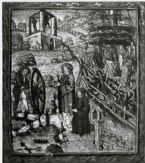
1. Murowana szubienica z XV w. w Lucernie — wolny dostęp http://pl.wikipedia.org/wiki/Plik:Richtplatz_Luzern.jpg

zmarłemu, ale też całej jego rodzinie. Dlatego sama szubienica stała się symbolem wstydu i hańby, natomiast śmierć na niej najczęściej groziła nieszlachetnie urodzonym. Nawet życzenie śmierci na szubienicy uważano za dużą zniewagę 15 . W źródłach często się wspomina, że znajdowała się przy granicy wsi, miasteczka lub poza miastem, gdyż nikt nie chciał jej mieć na własnej ziemi. Na przykład, w panoramie Grodna Hansa Adelhausera z 1568 r. szubienica została ukazana za miastem, na wysokim wzgórzu. Podobny widok mamy też w panoramie Kowna autorstwa Tomasza Makowskiego. W Wilnie szubienica w XVII w. stała nie na ziemi miasta, a na terenie jurysdykcji franciszkanów. Za to władze miejskie co roku płaciły pięć dukatów 16 . W XVI–XVII w. w Kłajpedzie szubienica stała na obrzeżach miasta, w miejscu zwanym „torfowisko szubieniczne”.