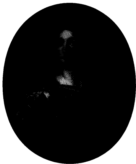
Kandidatas į Abiejų Tautų Respublikos sostą Liudvikas Pranciškus Juozapas Burbonas – kunigaikštis De Conti (1664–1709), XVII a.

Candidate to the Lithuanian-Polish Commonwealth throne Louis François Joseph de Bourbon – Prince of Conti (1664–1709), 17th c.