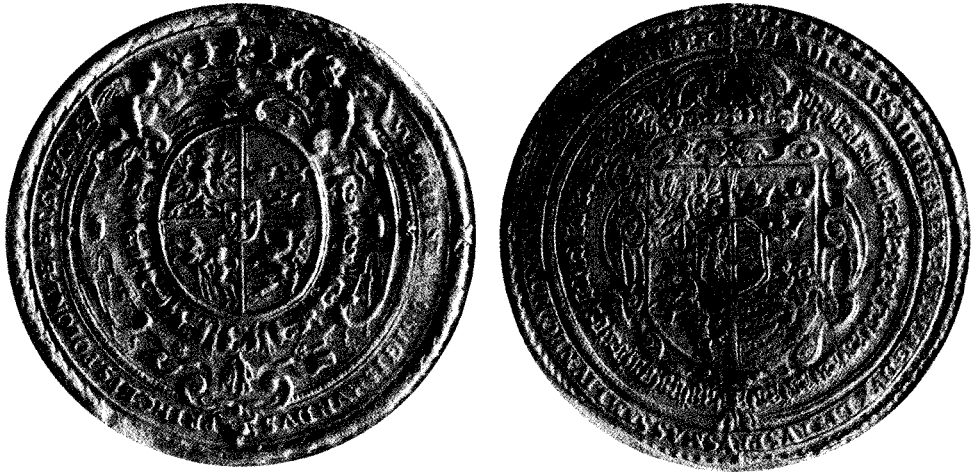
1628 m. karaliaičio Vladislovo ir 1635 m. valdovo Vladislovo Vazos raštinės antspaudai Office seals of Prince Ladislaus (1628) and King Ladislaus Vasa (1635)