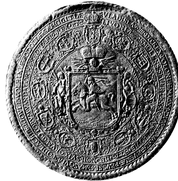
Vladislovo Vazos laikų Lietuvos didysis antspaudas su Švedijos Trimis karūnomis herbų žiede

The Lithuanian major seal with the Swedish Three Crowns in the ring of coats of arms during the reign of Ladislaus Vasa