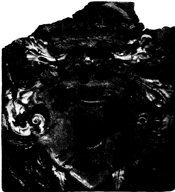
Vazų herbas Vilniaus Žemutinės pilies radiniuose: portalo herbinė detalė (apačioje) ir glazūruotas koklis (kairėje)

The Vasa coat of arms on the archaeological finds of the Vilnius Lower Castle: armourial portal detail (below) and a glazed tile (on the left)