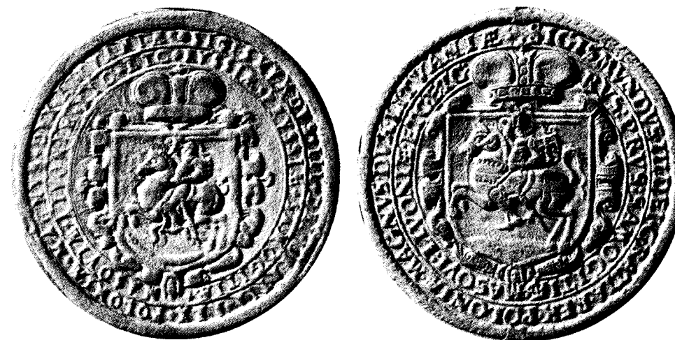
1588 m. Lietuvos mažieji antspaudai su Dvigubu kryžiumi ir Vazų Javų pėdu raitelio skydelyje The Lithuanian minor seals of 1588 with the Double Cross and the Vasa Sheaf on the knight's shield LMAVB

GNVS DVX LITVANIE RVSSLÆ PRVSSLÆ SAMOGITLÆ MAZOVLÆ LIVONLÆ ETC ETC. Pirmuoju keli dokumentai antspauduoti 1588 m. sausio 28 ir 29 d., o antrasis, kuris raštinės apyvartoje išliko apie 30 metų, pirmą kartą buvo prispaustas sausio 30 dieną 11 . Antspaudai iš pirmo žvilgsnio labai panašūs, bet turi vieną esminį skirtumą. Pirmajame raitelis turi skydą su Dvigubu kryžiumi, antrajame – jau su Vazų Javų pėdu. Tai neabejotinai rodė, kas valdo Lietuvos Didžiąją Kunigaikštystę. Galbūt šį lietuvių akibrokštą ar tiesiog neapsižiūrėjimą pastebėjo pats karalius ir pakancleriui teko skubiai taisyti klaidas. Paminėsime, kad per visą Vazų valdymo laikotarpį buvo išraižyti dar bent šeši mažieji valstybės antspaudai, penkiuose jų pavaizduotas Vazų Javų pėdas 12 .