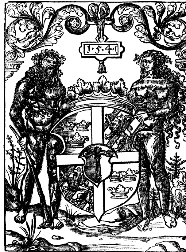
1541 m. Švedijos karalystės herbas

The coat of arms of the Kingdom of Sweden in 1541