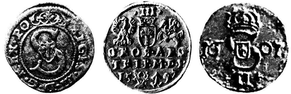
Vazų herbas Vilniuje kaldintose Lietuvos monetose: šilinguose, trigrašiuose ir dvidenariuose The Vasa coat of arms on Lithuanian coins minted in Vilnius: shillings, three-grosz and two-denar coins Sajauskas S., Kaubrys D. Lietuvos Didžiosios Kunigaikštystės numizmatika , [d. 2], Kaunas, 2006, p. 132, 193 ir kt.

Suprantama, valstybės antspaudai nebuvo prieinami kiekvienam krašto piliečiui. Tad bene labiausiai visuomenėje Vazų herbas buvo paskleistas per Lietuvos Didžiosios Kunigaikšt-