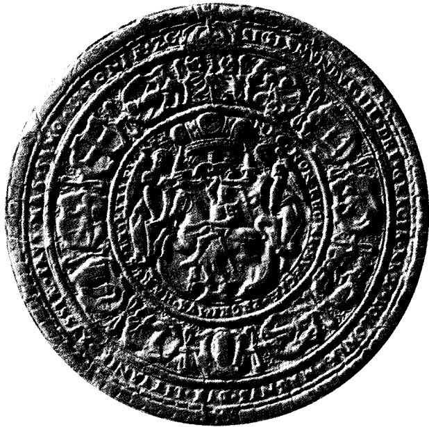
1590 m. Lietuvos didysis antspaudas su Vazų Javų pėdu herbų žiede The Lithuanian major seal of 1590 with the Vasa Sheaf in the ring of coats of arms

Tokia kompozicija išliko iki 1635 metų. Negana to, apie 1620 m. raižant kitą didįjį antspaudą turbūt per klaidą buvo pavaizduoti net du Vazų herbai: vienas – herbų žiede, kitas – raitelio skydelyje 15 . Kadangi 1632 m. valdyti pradėjęs Vladislovas Vaza perėmė tėvo antspaudą, legendoje pakeitė tik vardą, tad iš pradžių ir jo antspauduose išliko šis nesusipratimas 16 . Palyginti su mažaisiais, šiek tiek vėliau atsiradusių didžiųjų antspaudų legendose rašyta, kad Žygimantas Vaza yra ne tik Lietuvos ir Lenkijos valdovas, bet ir artimiausias Švedijos sosto paveldėtojas bei būsimasis karalius: SIGISMVNDVS TERCIVS DEI GRACIA REX POLONIE MAGNVS DVX LITVANIE RVSSIE PRVSSIE SAMOGITIE MAZOVIE LIVONIE QVE ET CETERA NEC NON REGNI SVECIE PROXIMVS HÆRES ET FVTVRVS REX 17 . Apie 1615 m. išraižytame naujame mažajame antspaudu legendos pabaiga buvo šiek tiek pataisyta: NEC NON SVECO(RVM) GOTO(RVM) VANDA(LORVM) HÆRED(ITARIVS) REX ETC 18 , ir jau be didesnių korektūrų naudota visuose Lietuvos antspauduose iki Vazų valdymo pabaigos 1668 m., tai yra ir po Olyvos taikos, kai buvo atsisakyta pretenzijų į Švedijos sostą.