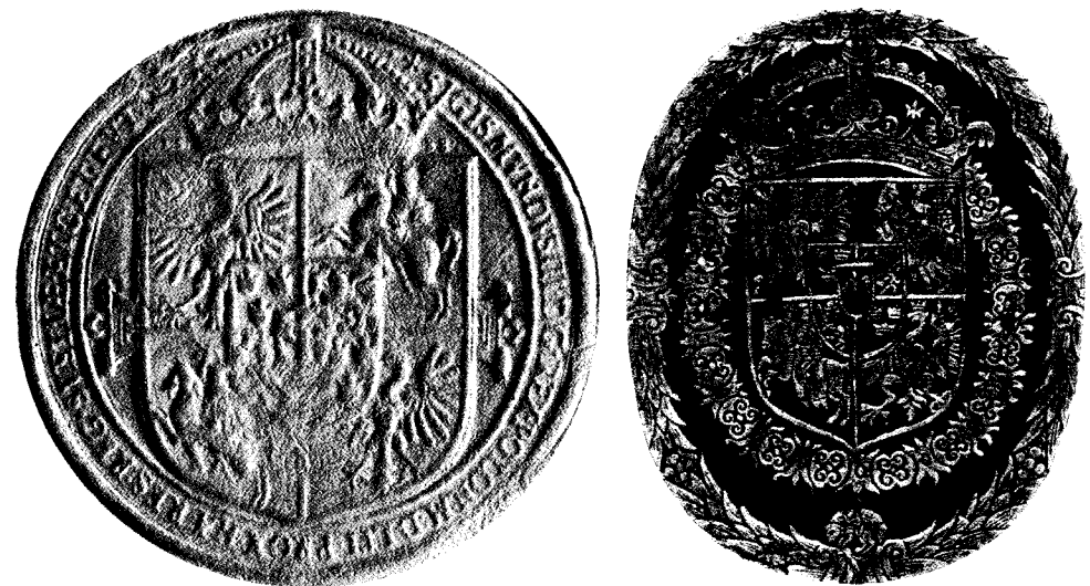
Devynių dalių jungtinis herbas Žygimanto Vazos 1596 m. raštinės antspaudė ir superekslibrise The nine-part joint coat of arms of Sigismund Vasa in the office seal of 1596 and in the super-exlibris AGAD

Kita valdovo raštinės antspaudų naujovė – pirmą kartą valstybinėje heraldikoje pasirodęs trisluoksnis daugialaukis skydas, sudarytas iš devynių ir net dešimt herbu. Didžiausiame apatiniame keturių laukų skyde pakaitomis pavaizduoti du Lenkijos Ereliai (pirmas ir ketvirtas laukai) ir du Lietuvos Raiteliai (antras ir trečias laukai), ant jo uždėtame panašios išvaizdos mažesniame viduriniame skyde tokiu pačiu principu išdėliotos Švedijos Trys karūnos ir Folkungų Liūtai, o herbo širdyje – Vazų herbas, Vladislovo ir Jono Kazimiero laikais kartais perskeltas skydas su Vazų Javų pėdu ir Habsburgų juosta. Šiuo herbu Žygimantas Vaza, o vėliau ir jo sūnūs – Vladislovas ir Jonas Kazimieras – siekė įprasminti save kaip Vazų dinastijos Lietuvos didžiųjų kunigaikščius ir Lenkijos karalius, taip pat turinčius prigimtinę teisę (pretenziją) į Švedijos sostą. Pirmą kartą toks herbas pasirodė Žygimanto Vazos raštinės antspauduose 1588 m. ir išliko iki Vazų valdymo pabaigos 49 . Tas pats pasakytina ir apie kai kuriuos Žygimanto Vazos bei Jono Kazimiero signetus, kuriais buvo antspauduojama asmeninė į abu kraštus siunčiama korespondencija 50 . Be raštinės antspaudų ir signetų, daugialaukį skydą, sudarytą iš devynių herbu figūrų, galima rasti 1611 ir 1621 m. Žygimanto Vazos medaliuose 51 , Abiejų Tautų Res-