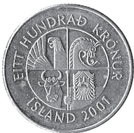
3 ir 4 pav. Islandijos herbe ir monetų averse vaizduojamos dvasios žemės saugotojos

piktą lemtį, sunkią dalią ir nelaimes. Jie, kaip buvo tikima, prisigretindavo prie žmonių tik tam tikrais gyvenimo tarpsniais ar momentais, sunkių išbandymų metu 14 .