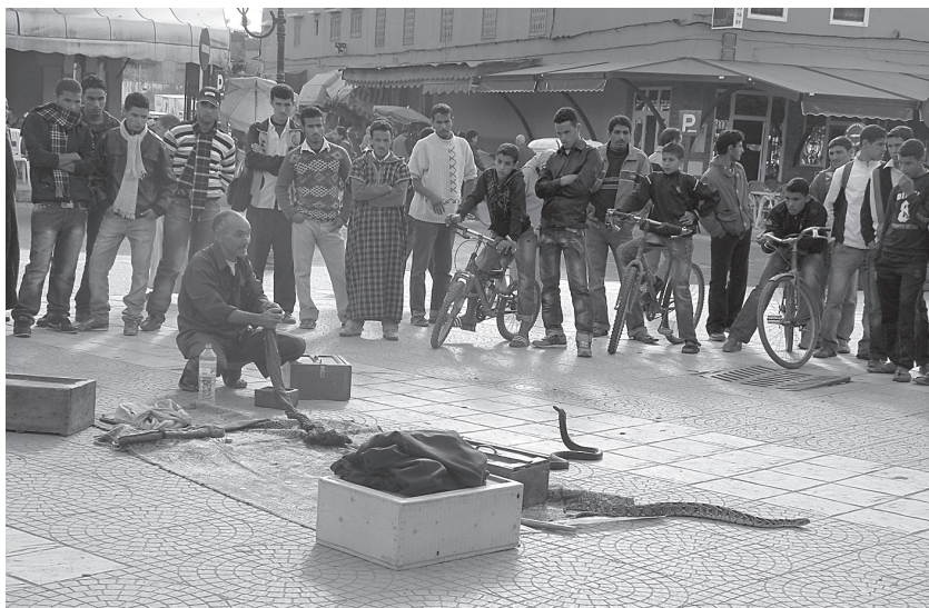
8 pav. Gyvačių kerėtojas linksmina publiką Jemaa el-Fnaa aikštėje Marakeše, Maroke (L. Mikailos nuotr.)

Kita vertus, vietų unikalumui XX a. antroje pusėje vis didesnį iššūkį metė ir masinis vartojimas bei konvejerinio tipo turizmas, paradoksaliai prisidedantis ne prie didesnės vietų išskirtinumo pajautos, o priešingai, generuojantis jų masinį kopijavimą ir tiražavimą – šie procesai vis labiau išibėgėja didesniais ar mažesniais masteliais kar-tojant Las Vegaso modelį (9 pav.) ir įgauna visur prasismelkiančios makdisneizacijos formą 52 . Tad nėra ko stebėtis, kad į didėjantį aplin-kos standartizavimą ir dehumanizavimą reagavo besiformuojančios fenomenologinės architektūros krypties atstovai, tarp jų veikiai