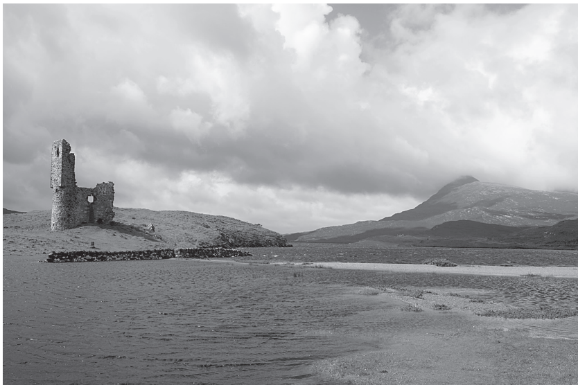
6 pav. Vaizdingi kraštovaizdžiai iki šiol tebekelia romantiškus jausmus.