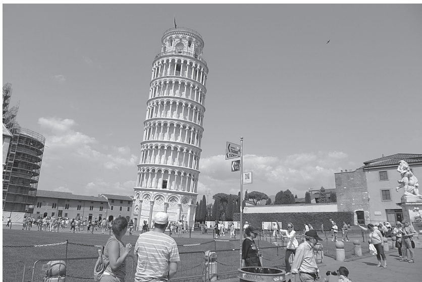
1 pav. Turistams besifotografuojant prie Pizos bokšto privalu jį „paremti“

antikinės kultūros ir pasaulėjautos, kuri gali tapti vaisinga ir naujai bei konstruktyviai vartojama įvairiuose šiandienos socialiniuose kontekstuose, paremtuose dialoginiu santykiu su gyvenamąja aplinka. Kartu aiškiai suvokiama, kad siekis sintezuoti fragmentiškai pabirusias kultūros išvalgas, kaip ir siūlymai grįžti prie termino ir reiškinių sakraliųjų ištakų nūdieniame sekuliarizuotame pasaulyje, nėra prasmingi, nes hierofanijas ir piligrimystės vietas šiandien vis labiau keičia ar atstoja „atminties vietas“ (Pierre Nora vartota prasme) bei vartotojiškas išskirtinių vietų įvaizdžių – simuliakrų – tiražavimas. Iš pažiūros nekaltas, literatūrų vėl nūnai atgaivintas genius loci poetizmas iki šiol neišvengia esminių intelektualų ginčų ir kartkartėmis virsta ypač painia aporija. Vis dėlto, pastebėjus neabejotiną šios sąvokos polinkį į ekstensyvumą, verta pabandyti ją intensyvinti, šitaip siekiant geriau integruoti subjektyvųjį ir objektyvųjį šio reiškinių sandus.