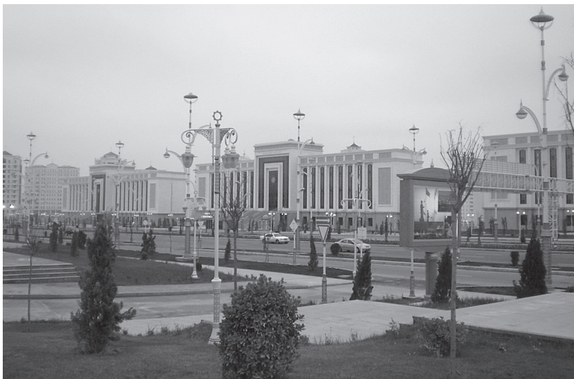
7 pav. Naujieji Turkmėnistanos sostinės Aščabado prospektai

Tačiau esama ir vietų, išvengiančių perdėtos valdžios kontrolės – tai tos miestiečių ir turistų pamėgtos erdvės, kuriose klesti komercinių ir kultūrinių veiklų įvairovė, buriasi neformalus sąjūdziai, vyksta šventės ar demonstracijos, gatvės performansai. Kai kurios iš jų tapusios net demokratijos simboliais, pavyzdžiui, Times skveras Niujorke, Trafalgaro aikštė Londone, Indijos vartai Mumbajuje, Zokalo aikštė Mechike ar Jemaa el-Fnaa aikštė Marakeše, Maroke (8 pav.). Šiai turbūt žymiausiai Afrikos aikštei, kurioje šimtmečiais rinkdavosi vietiniai pasakų sekėjai ir artistai, beje, neseniai buvo iškilusi sunaikinimo grėsmė dėl planuotų aukštuminio pastato statybų, bet kilusi tarptautinė reakcija užkirto tam kelią ir tuo pačiu leido į tarptautinę paveldosaugą įtraukti naują – kultūrinių erdvių apsaugos – terminą 51 .