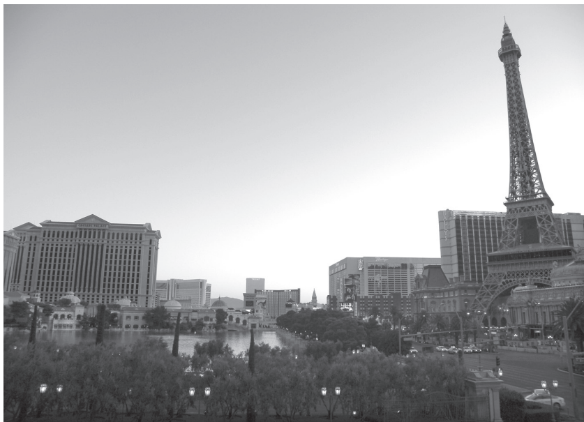
9 pav. Las Vegas (JAV) surenka žymiausių pasaulio vietų įvaizdžius (L. Mikailos nuotr.)

pirmais smuikais ėmė griežti C. Norberg-Schulzas 53 , D. Canteris 54 , K. Lynchas 55 , F. Steele 56 ir kiti.