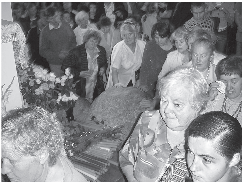
2 pav. Pilgrimai koplyčioje eina keliais aplink akmenį, ant kurio, kaip tikima, Šiluvoje XVI a. apsireiškė Švč. Mergelė Marija

lią, malones bei nurodymus, kartu dangun nunešti žmonių maldas, prašymus ir aukas. Būdami ribinėje padėtyje tarp vieno ir kitų, vidiniu ryšiu tarp Dangaus ir Žemės, tylinčios Transcendencijos ir triukšmingo žmonių pasaulio, jie leido rasti tokiems seniesiems menams kaip pranašavimas, kerėjimai ir apskritai visa, ką galima būtų priskirti ezoterinių žinių, slėpinių, aukojimų ir magijos sričiai. Genijai, kurių būta daugybės ir įvairių, siūsdami žmonėms tam tikrus ženklus ar išvalgas, siekė nukreipti juos reikiama linkme pašnibždėdami, kaip elgtis tam tikrose situacijose, taigi buvo lyg vidinis balsas, sąžinė, sergstinti ir palydinti nemirtingą žmogaus sielą jam skirtuoju keliu. Tuo jie skyrėsi nuo kitų panašių dangiškujų būtybių – demonų ( daemon ), įkūnijančių