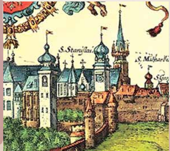
Wawelio katedra XVI a. pab. /

Tematykę z zakresu dziejów katedr krakowskiej i wileńskiej podejmowano wielokrotnie, ale nigdy w powiązaniu ze sobą. Oba kościoły odegrały i odgrywają nadal znaczącą rolę w kształtowaniu świadomości narodowej Litwinów i Polaków, ich kultury politycznej, dawnych i współczesnych tradycji państwowych. Więzy między tymi kościołami katedralnymi występowały na poziomie ordynariuszy diecezji oraz kapituł katedralnych, a ich decyzje miały dalekosiężne skutki geopolityczne, gospodarcze i kulturowe. Tymczasem liczne kwestie badawcze dotyczą w równym stopniu obu świątyń ulokowanych w dwóch stołecznych miastach Rzeczypospolitej Obojga Narodów, tj. Królestwa Polskiego i Wielkiego Księstwa Litewskiego. Postawienie względem nich tych samych pytań oraz wskazanie na podobieństwa i różnice między nimi może przynieść zupełnie nowe i nieoczekiwane wyniki. Zakres tematyczny konferencji wymaga udziału specjalistów z różnych dziedzin – historii i nauk pomocniczych historii, historii sztuki, literaturoznawstwa, kulturoznawstwa i in., co zapewni szerokie i wieloaspektowe ujęcie problematyki wiążącej się z ponad 600-letnim okresem współistnienia dwu najważniejszych świątyń Litwy i Polski.