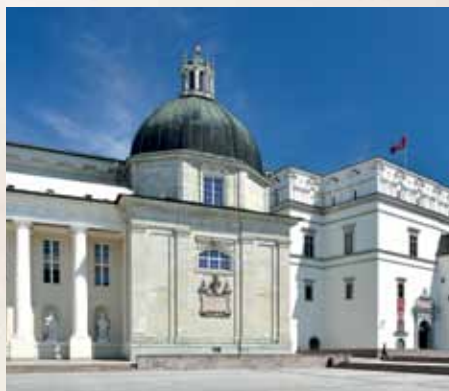
Šv. Kazimiero koplyčia pietiniame Vilniaus katedros kampe / Kaplica św. Kazimierza w południowym rogu katedry wileńskiej