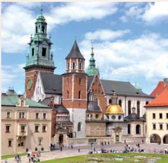
Krokuvos Vavelio katedra / Katedra na Wawelu w Krakowie