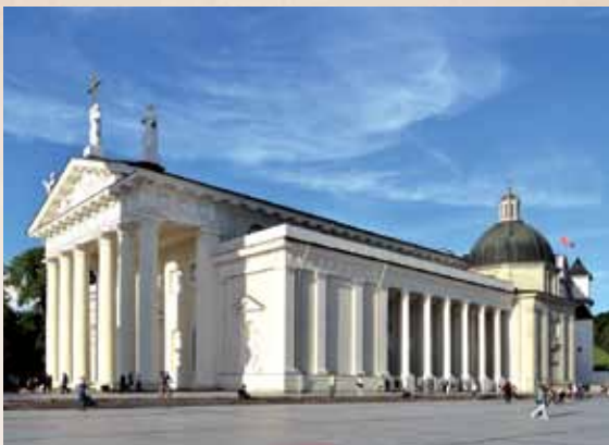
Vilniaus katedra / Katedra w Wilnie