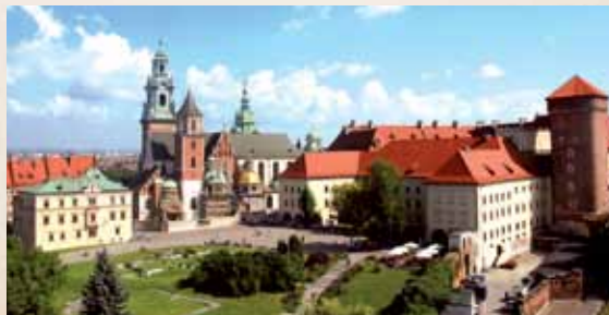
Krokvos katedra ir Vavelio karališkoji pilis nuo Sandomiero bokšto / Widok na katedrę i Zamek Królewski na Wawelu z baszty Sandomierskiej