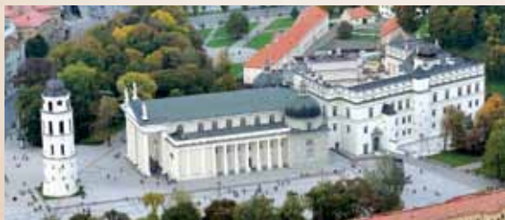
Vilniaus katedra ir Lietuvos didžiųjų kunigaikščių rūmai iš paukščio skrydžio / Katedra wileńska i pałac wielkich książąt litewskich z lotu ptaka

Vilniaus vyskupystės susikūrimas 1390–1391 m. / Powstanie biskupstwa wileńskiego w 1390–1391 roku