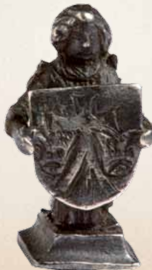
Angelas, laikantis skydelį su Vilniaus katedros kapitulos herbu, XV a. – XVI a. pr. / Anioł trzymający tarczę z herbem Wileńskiej Kapituły Katedralnej, XV w. – pocz. XVI w. Bažnytinio paveldo muziejus, Vilnius